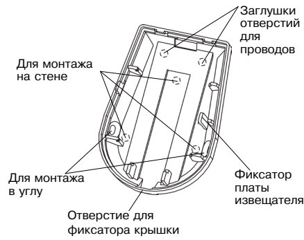
Рисунок 2 – Основание извещателя

Примечание – Для надежного исключения ложных срабатываний от домашних животных, не рекомендуется, при установке извещателя, отклонение его положения от вертикали более чем на 2°.